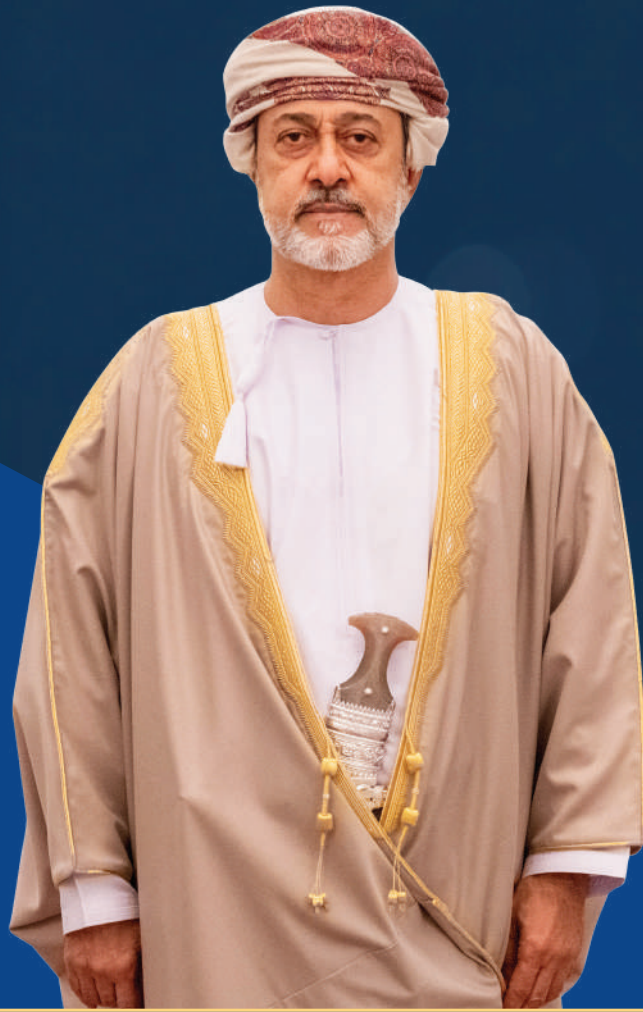
حضرة صاحب الجلالة السلطان هيثم بن طارق